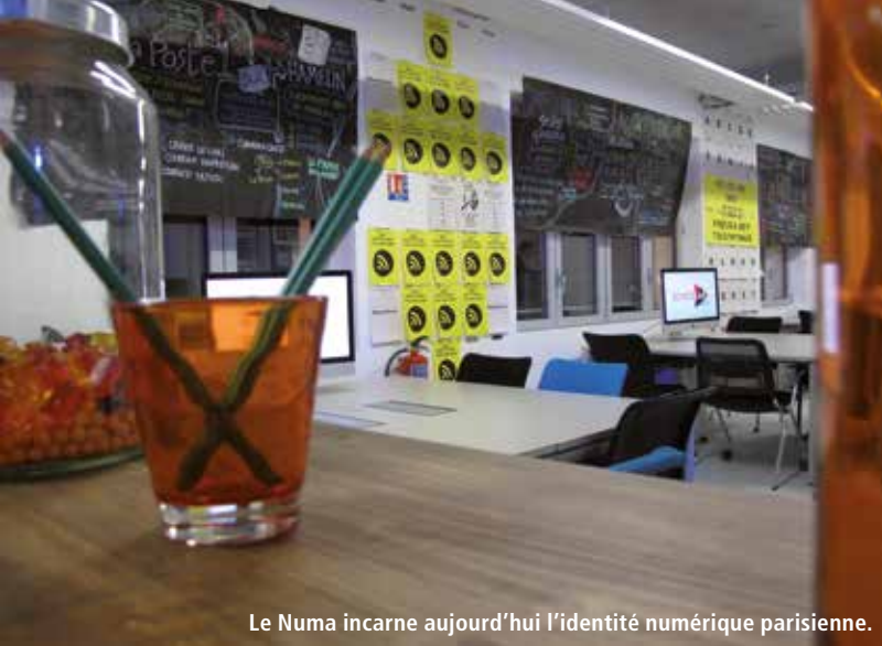
Le Numa incarne aujourd'hui l'identité numérique parisienne.

flux et promouvoir l'usage de la voie d'eau et du rail et ainsi limiter l'impact néfaste du transport routier sur l'environnement et diminuer la pollution de l'air.