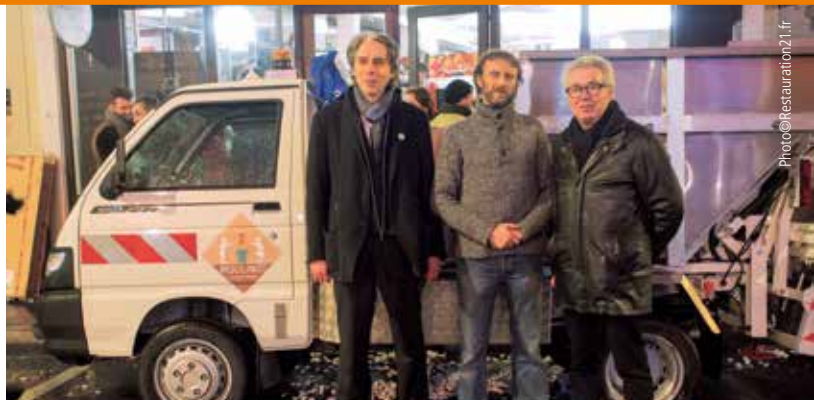
Le PLU modifié permettrait de mieux gérer les ressources. Sujet sur lequel travaille Moulinot Compost & Biogaz dans le 2 e .

dans le 2 e , du mur végétal inauguré, l'année dernière, à l'angle des rues Aboukir et Petits Carreaux. Cette jungle verticale d'une surface de 245 m 2 permet aux citoyens que nous sommes de nous reconnecter avec la nature ! Et préserve la biodiversité : des oiseaux migrateurs y font une halte ; des abeilles butinent ; des papillons s'y installent ; des espèces vivantes se développent et se pérennisent en pleine jungle urbaine. Toujours dans le cadre de la protection de l'environnement, le PLU modifié permettrait de mieux gérer les ressources et de privilégier l'économie circulaire. Et ce, via l'amélioration des mesures réglementaires dans les domaines des grands services urbains indispensables au bon fonctionnement de la ville et la localisation de services correspondants. Que cela concerne l'amélioration de la gestion des eaux, le recyclage, la lutte contre toutes les formes de pollution, ou encore la gestion responsable des déchets. Là encore, le 2 e est un arrondissement précurseur puisqu'il abrite, au 13 rue Léopold Bellan, la Ressourcerie Paris-Centre. Premier lieu dédié à l'économie circulaire du centre de la capitale. Objectif : faire de la prévention des déchets