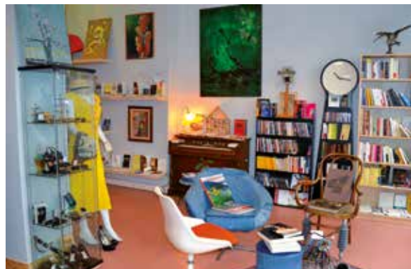
La Ressourcerie Paris-Centre.

règlement en matière de stationnement : imposition d'une norme maximale de stationnement de véhicules motorisés pour les constructions neuves de bureaux et normes minimales pour le stationnement des vélos. Par ailleurs, si, actuellement, 90 % de l'acheminement des marchandises se fait par la route, divers projets d'équipements logistiques peuvent être inscrits dans le PLU. Et ce, afin de rationaliser l'organisation de ces