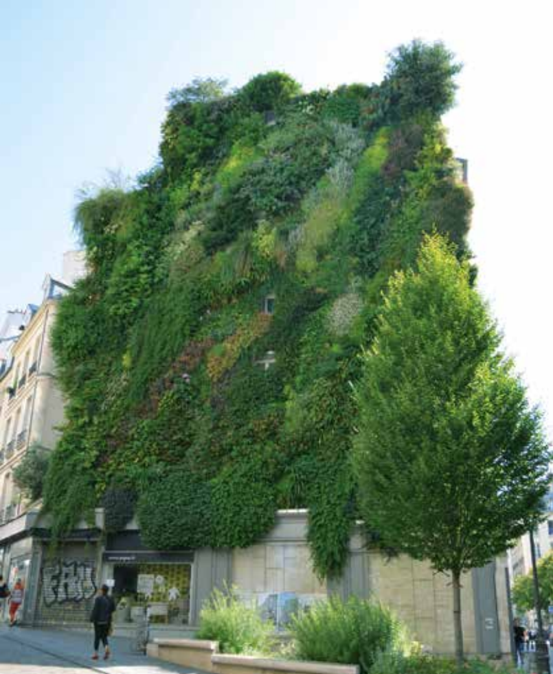
Le nouveau PLU pourrait encourager la végétalisation des espaces libres, à l'instar du mur de la rue d'Aboukir.

disposant de revenus moyens, qui ne sont pas prioritaires pour le logement social, mais pour qui les prix du marché sont inaccessibles. Le PLU peut ainsi contribuer à la fois à la production de logements sociaux et de logements intermédiaires. Par ailleurs, l'idée consiste à amorcer une réflexion sur l'évolution des règles de gabarit, notamment sur les voiries de grande largeur, dans le respect du paysage parisien et du plafond des hauteurs.